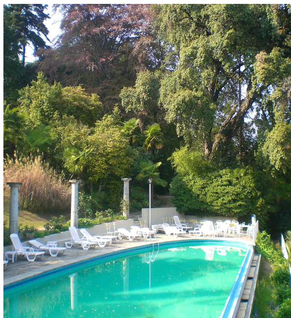
Sopra: Il parco e la piscina di villa Carlotta. Maestoso su tutto lo splendido sughero che conta ad oggi quasi quattro secoli di vita.

Non si può non ricordare che nel meraviglioso parco di villa Carlotta si trova una quercia di sughero d'oltre trecento anni, e ancora ipocastani, cedri del Libano, e un'immensa sequoia, che si uniscono armoniosamente al resto della vegetazione.